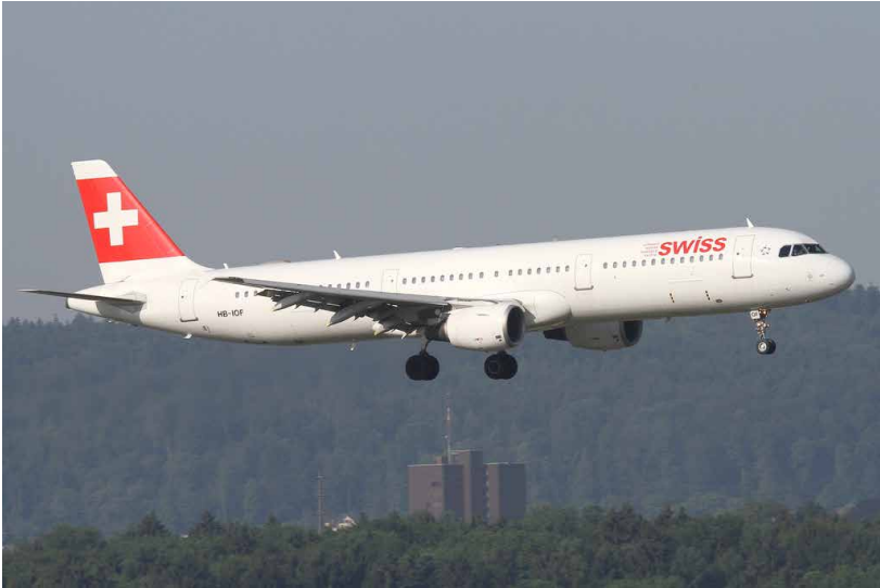
Flug 3: Genf (GVA) – Zürich (ZRH) mit der SWISS A-321-111, HB-IOF