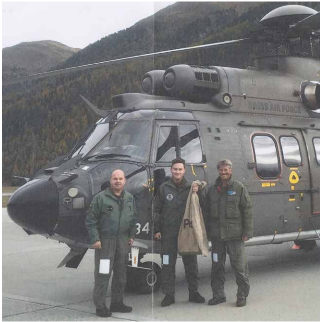
Flug 6: Samedan – Locarno Magadino; die Crew des „Cougars“ (Super Puma)