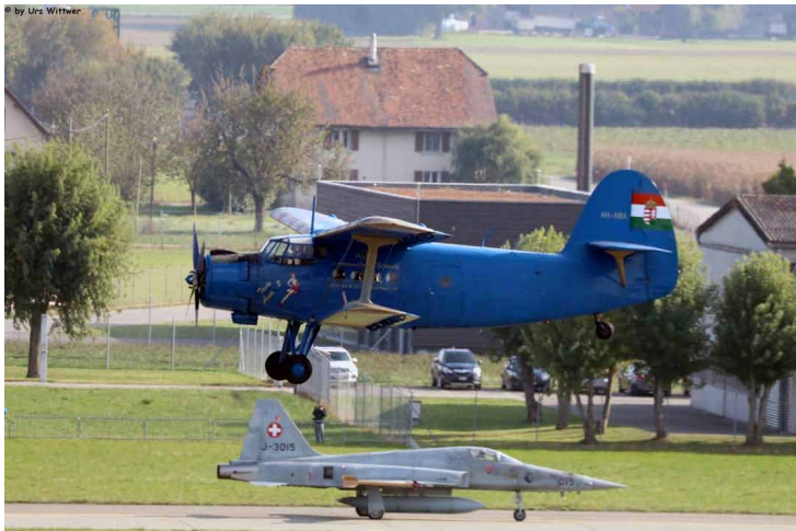
Flug 7: Locarno Magadino – Payerne; eine eher ungewöhnliche Begegnung in Payerne