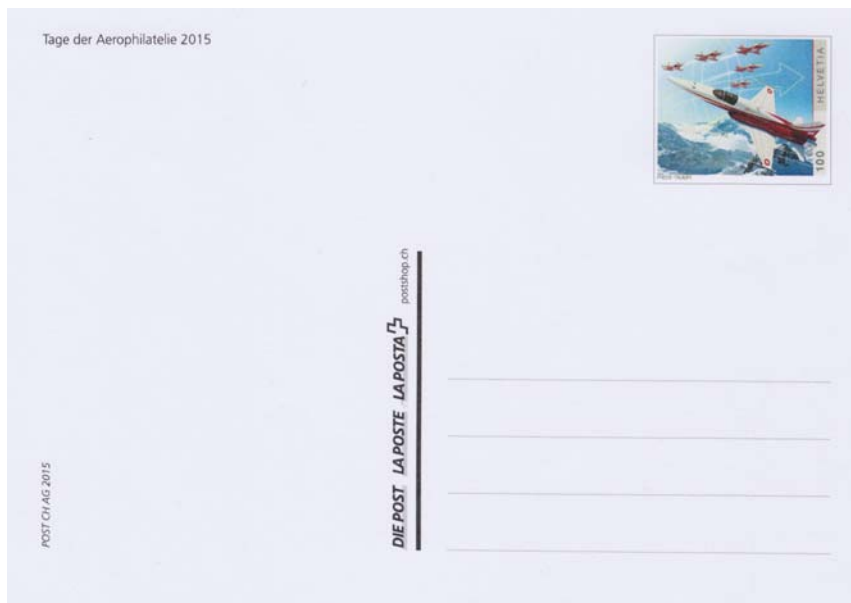
Die Sonderpostkarte der Post CH AG mit der eingedruckten Marke (Tiger F-5) von 2014, aber mit der Denomination 100 Rappen